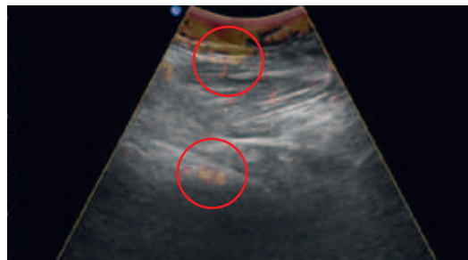
Ultraschall-Elastografie des linken Adduktors Triggerpunkte = rot umrandete gelbe Zonen

die Muskeln des Rückens, der Hüften, der Beine sowie der Beckenboden auf Triggerpunkte untersucht werden. Denn auch von dort senden sie Schmerzsignale in die Beckenregion. Der Beckenschmerz tritt selten alleine auf und häufig findet man auch Nacken-, Schulter-, Rücken- und Beinschmerzen. Das Stehen, Gehen und Sitzen kann zur zusätzlichen Qual werden.