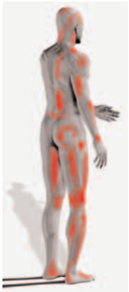
Gelenk- und Muskelschmerz durch Triggerpunkte

Die Studie bestätigt, dass TrP in jedem Muskel sein können. So erklärt sich, dass sie überall Schmerzen auslösen können. Diese Erkenntnis ist sehr wichtig für eine wirksame Therapie, denn zu viele Menschen laufen mit ihren Beschwerden über Jahre von einem Arzt zum anderen. Sie probieren sowohl herkömmliche als auch alternative Heilmethoden aus, ohne die wirkliche Ursache der Schmerzen zu ergründen. Wenn man dann endlich eine Ursachenforschung betreibt, zeigt sich in den meisten Fällen, dass TrP die Schmerzverursacher sind. Das jedoch wurde von Ärzten nicht erkannt, denn sie waren weder im Röntgen noch MRT oder Ultraschall erkennbar. Viele Ultraschallgeräte haben die US-E schon für die Tumordiagnostik eingebaut und können ebenso für die Darstellung der Triggerpunkte benutzt werden.